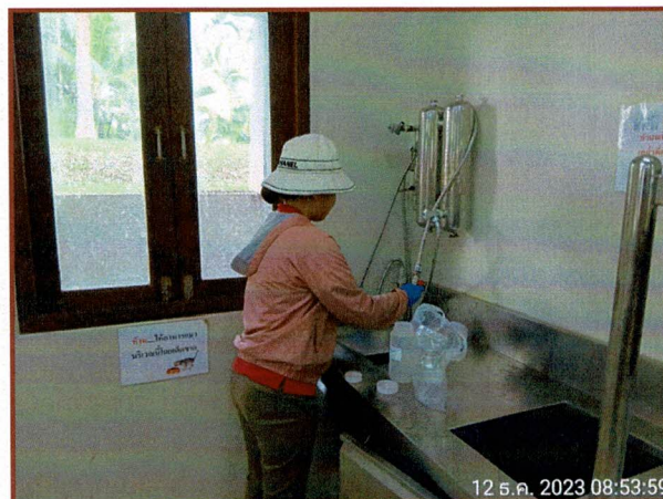
ภาพที่ 3 แสดงการเก็บตัวอย่างคุณภาพน้ำใช้ (พื้นที่ส่วนกลาง)